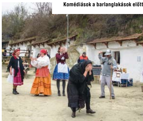
Komédiások a barlanglakások előtt

Az Egerszalókot, Demjént és Egerszólátot összefogó Gyógyvizek Völgye TDM Egyesület Eger „ármékából” kilépve, önálló, komplex kínálattal rendelkező desztinációként 3,6-szorosára növelte vendégéjszaka-számát az elmúlt hat évben.